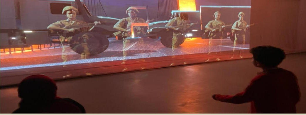
Bilim Merkezi Gezisi